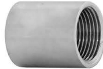
UNIÃO COM ASSENTO INTEGRAL FÊMEAxFÊMEA / MACHOXFÊMEA